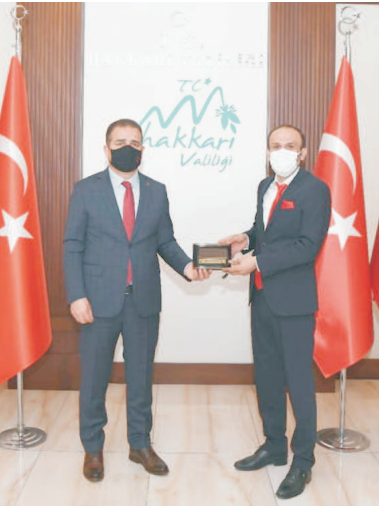
Rize'de bulunan Anadolu Kültür Eğitim

Hakkâri Valiliğinde AKES-DER Yönetimini kabul eden Hakkâri Valisi İdris Akbıyık, AKES-DER yönetimi tarafından hazırlanan sunumu izledi. Hazırlık çalışmalarını başlatan Vali İdris Akbıyık AKES-DER Başkanı Hasan Kansızoğlu ve yönetimi ile görüş alışverişinde bulundu. Merkezi